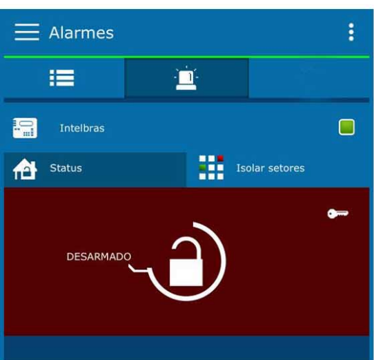
imagem abaixo, se alarme estiver desarmado, vai estar em vermelho, basta clicar em cima e armar , ou desarmar . Esta tela pode variar um pouco de acordo com modelo da central que você tem instalada em sua empresa ou residência.

Faça aqui sua avaliação de nossa empresa !!!